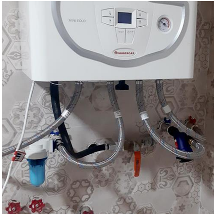
نصب فیلتر مگنی ۲ و پلیدو

توجه داشته باشید که استفاده از فیلترهای نامناسب یا عدم سرویس به‌موقع آن‌ها می‌تواند منجر به بروز مشکلات جدی‌تر در سیستم گرمایشی شود. بنابراین، توصیه می‌شود که فیلترها را به‌صورت دوره‌ای بررسی و در صورت نیاز، آن‌ها را تمیز کنید. این اقدام نه‌تنها کیفیت گرمایش و عملکرد سیستم را بهبود می‌بخشد، بلکه از آسیب‌های احتمالی و هزینه‌های اضافی جلوگیری کرده و عمر مفید پکیج شوفاژ دیواری را افزایش می‌دهد.